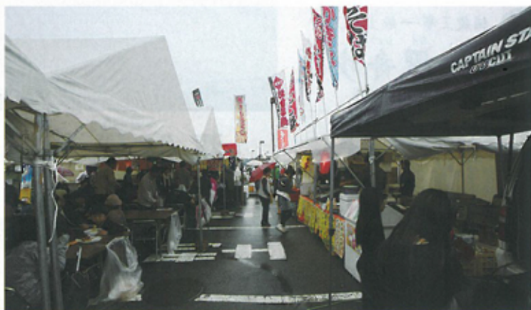
おいしい食べ物たくさんあります