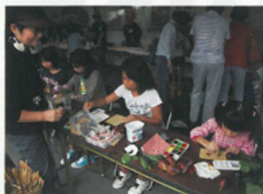
ヨシベン作りとはがき絵描き