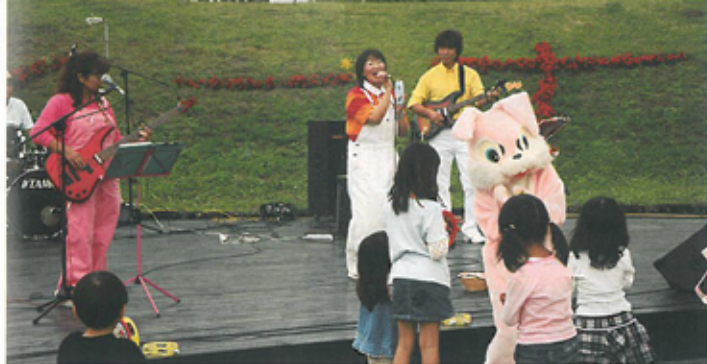
メルヘンドリーム