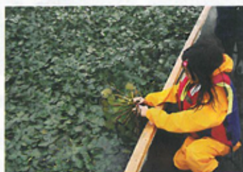
潟舟で潟めぐりとヒシ採り体験