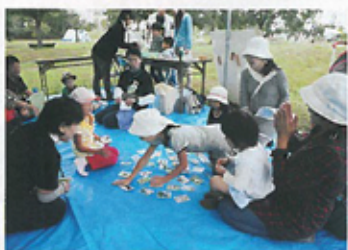
福島潟生きものカルタ