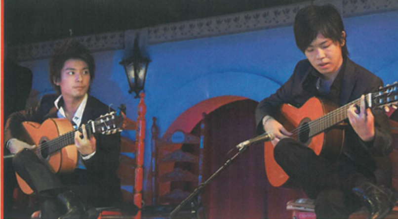
フラメンコギター DUO

※出演時間は都合により変更になる場合があります。 ※雨天時は6階展望ホールで14:30から開催。